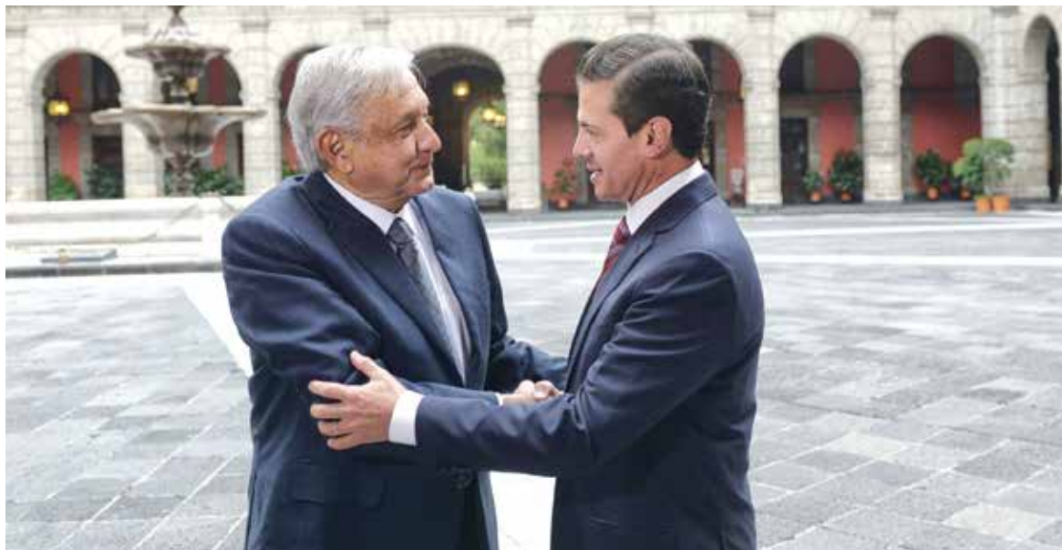
PALACIO NACIONAL. Ayer dio inicio el proceso formal de transición hacia la próxima administración.

ECONOMÍA, MERCADOS Y NEGOCIOS ALIANZA CON Bloomberg