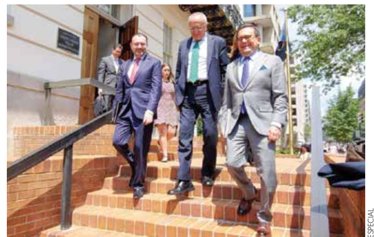
OPTIMISMO. Los negociadores mexicanos al salir de la reunión con el USTR.

un acuerdo. Sin embargo, temas complicados, como la cláusula 'sunsent', que obligaría a renegociar el TLCAN cada 5 años, se dejarán para el final, aclaró. —Daniel Blanco ECONOMÍA / PÁG. 4