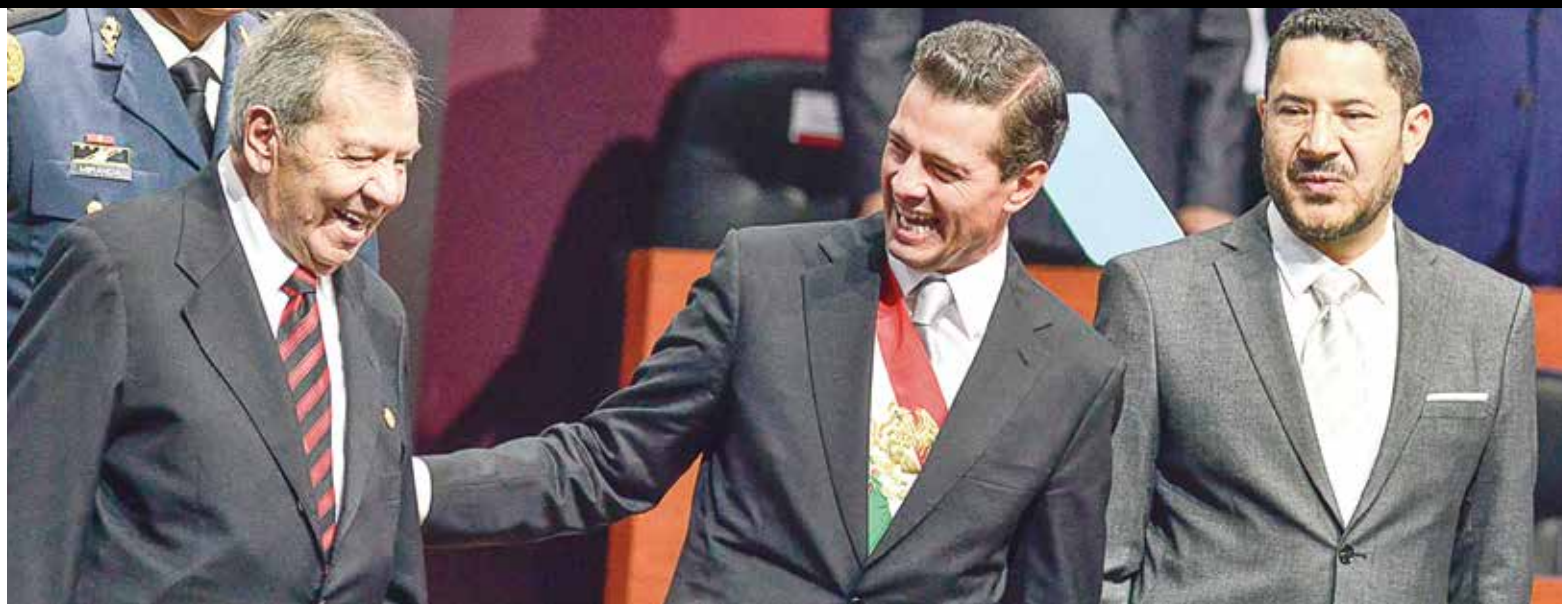
CONVIVENCIA POLÍTICA. El primer mandatario estuvo acompañado por el presidente de la Mesa Directiva de Diputados, Porfirio Muñoz Ledo, y por el del Senado, Martí Batres.