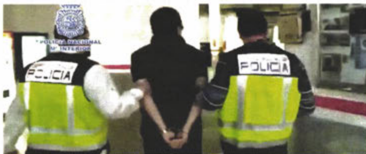
UBICADO. Dice policía de España que lo identificaron por una licencia de conducir.

En México, Alejandro Gertz, titular de la FGR, dijo que la or-