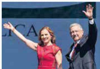
NUEVA PATRIA. En diciembre de 2020.

En su discurso, ante un Zócalo lleno, dijo: "Lo viejo no acaba de morir y lo nuevo no termina de nacer".