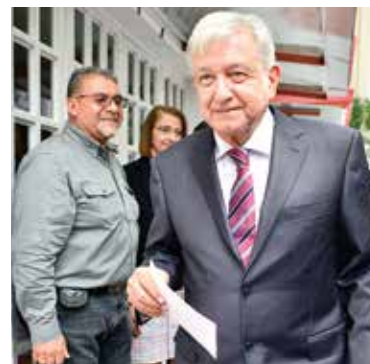
AL RESCATE. Dice AMLO que ya prepara el plan para extraer más petróleo.