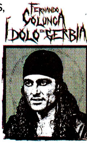
Arte: Julio Ang