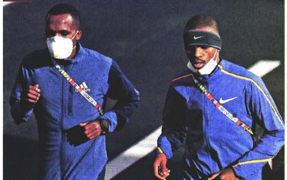
Participantes en la maratón de Tokio 2020 usaron mascarillas para evitar contagios.