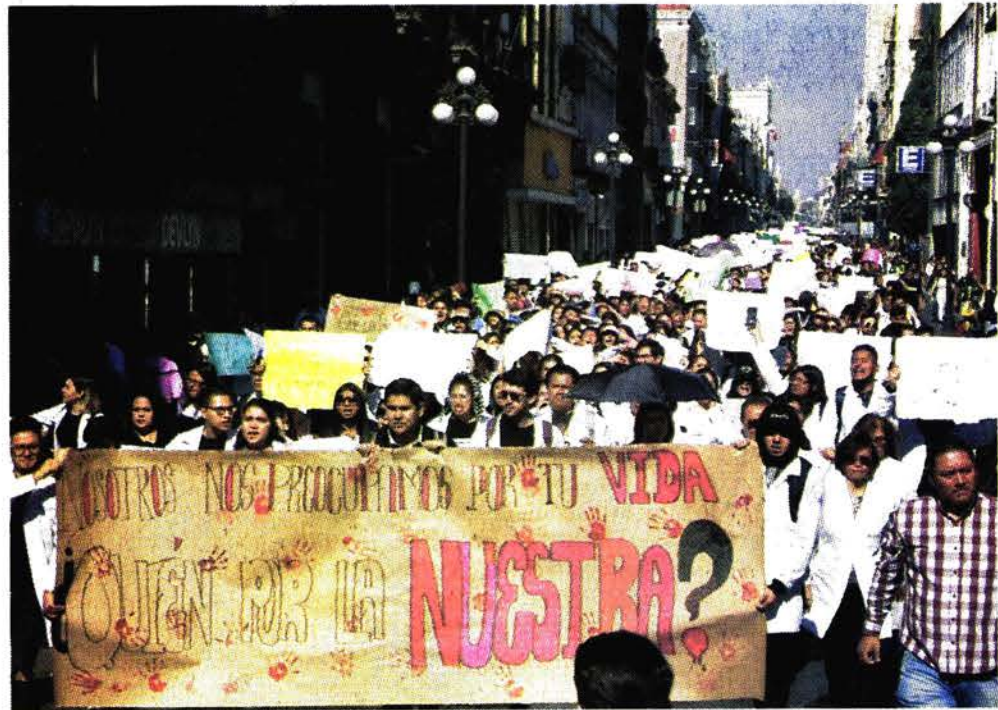
Alumnos marcharon para exigir justicia para sus tres compañeros.