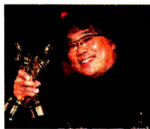
Bong Joon Ho