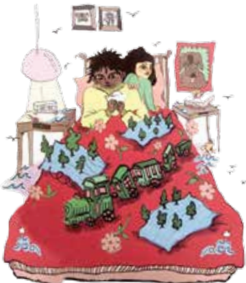
Ilustración tomada del libro Tren musical de palabras