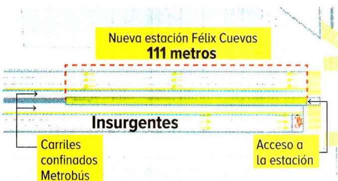
Gráfico: Erick Zepeda