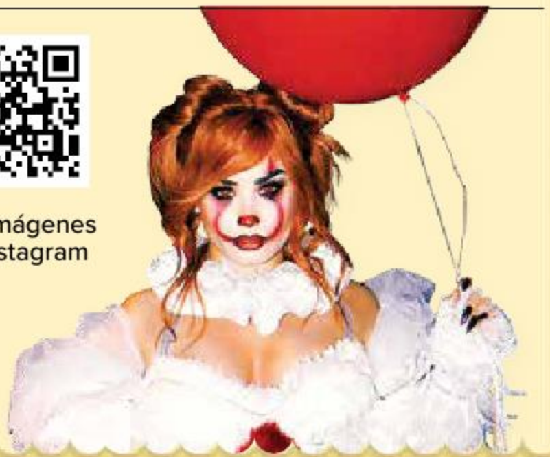
Ilustración: Horacio Sierra

NADIE SABE DÓNDE ESTÁ EL SEGUNDO DE ROBLES