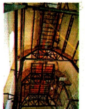
PRIMERA | PÁGINA 26

La Auditoría halló probable daño al erario por 226 mdp sobre proyectos de 2017 de los que no hay evidencia de su realización.