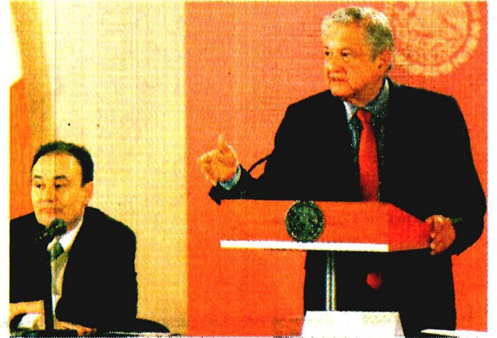
Andrés Manuel López Obrador encabezó ayer, por primera vez, la instalación del Consejo Nacional de Seguridad Pública.