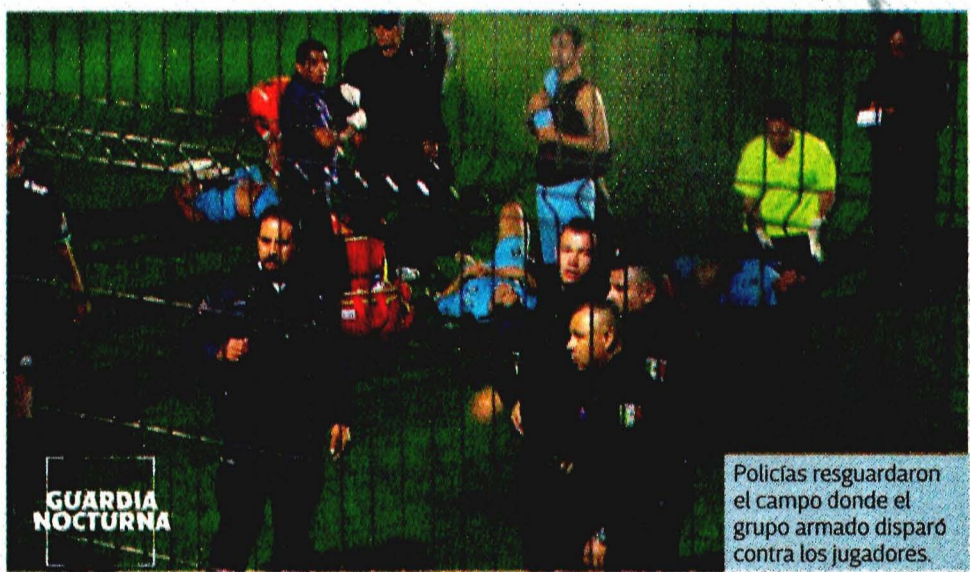
Policías resguardaron el campo donde el grupo armado disparó contra los jugadores.