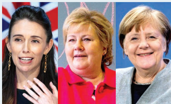
JACINDA ARDERN N. Zelanda