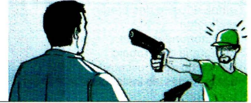
Ilustración: Abraham Cruz