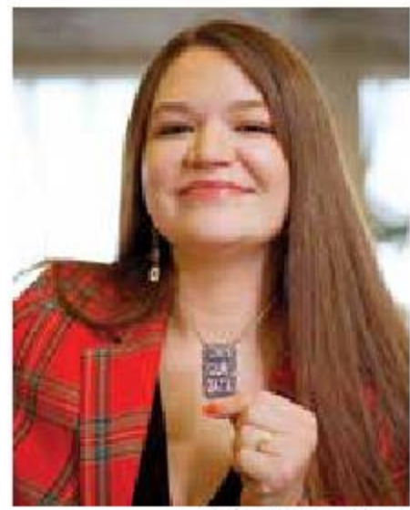
Brittany Kaiser, exintegrante de Cambridge Analytica.

Sin embargo, el rezago tecnológico en muchas áreas del país, aunado a la falta de archivos nacionales, dificultó el trabajo de la empresa, desaparecida luego del escándalo por el mal uso de los datos obtenidos de Facebook para ayudar en la elección de 2016 en Estados Unidos, en la cual Donald Trump resultó victorioso.