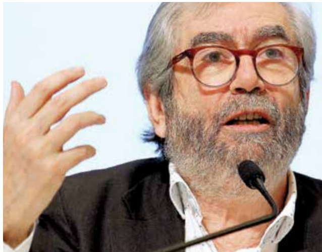
ANTONIO MUÑOZ MOLINA

"INJUSTICIA, RETO DE LA DEMOCRACIA" Desde la FIL de Guadalajara, el Premio Nobel considera que combatir la migración que genera la desigualdad es uno de los grandes desafíos de nuestros tiempos. PRIMERA | PÁGINA 26