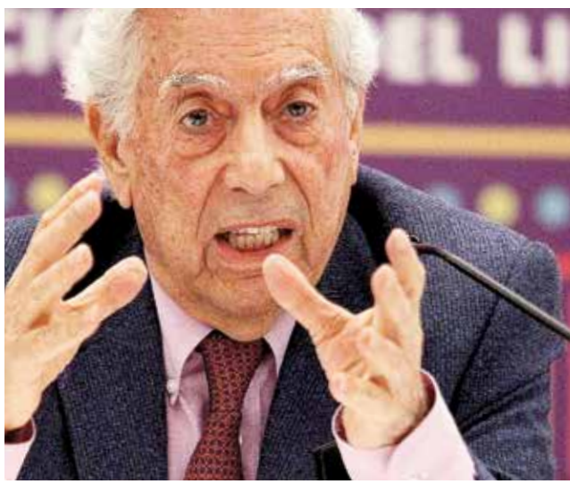
MARIO VARGAS LLOSA

"INJUSTICIA, RETO DE LA DEMOCRACIA" Desde la FIL de Guadalajara, el Premio Nobel considera que combatir la migración que genera la desigualdad es uno de los grandes desafíos de nuestros tiempos. PRIMERA | PÁGINA 26