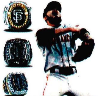
2010, 2012, 2014 Sergio Romo Gigantes de San Francisco