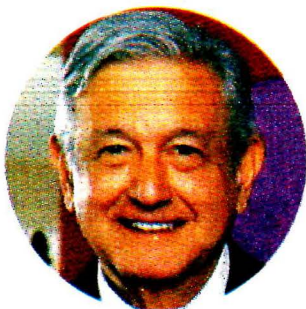
Andrés Manuel López Obrador.

Reiteró que, si bien se trata de impulsar la inversión privada en sectores estratégicos, se reforzará la rectoría del Estado en el