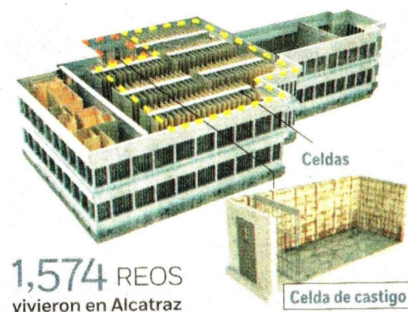
Gráfico: Erick Zepeda