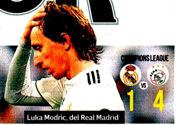
Luka Modric, del Real Madrid

SEMANA DE FRACASOS En unos días, el Madrid se quedó sin posibilidad de ganar los torneos de Liga, de Copay y la Champions.