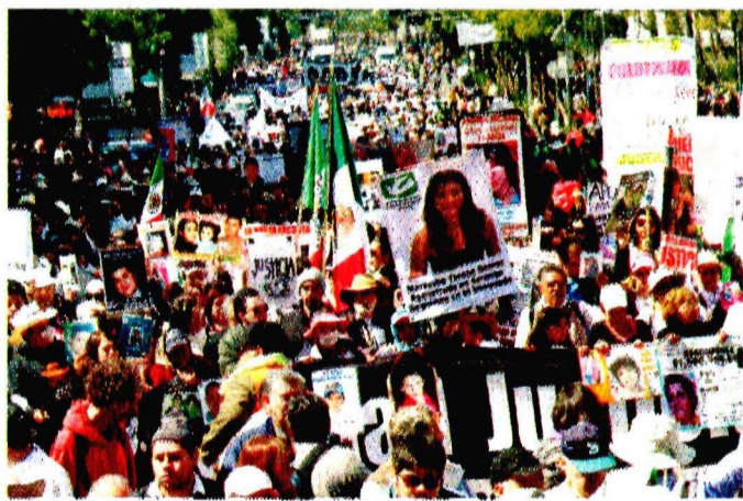
MARCHA POR LA PAZ