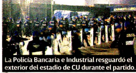
La Policía Bancaria e Industrial resguardó el exterior del estadio de CU durante el partido.