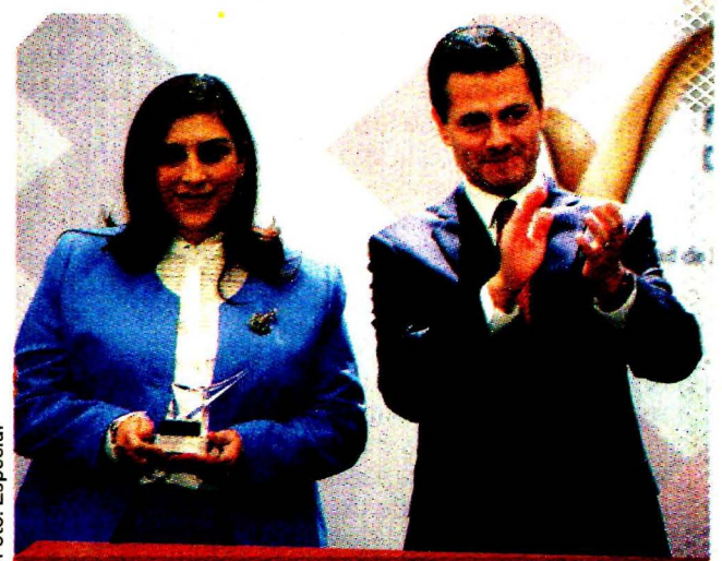
ENTREGA PREMIO NACIONAL DE CALIDAD