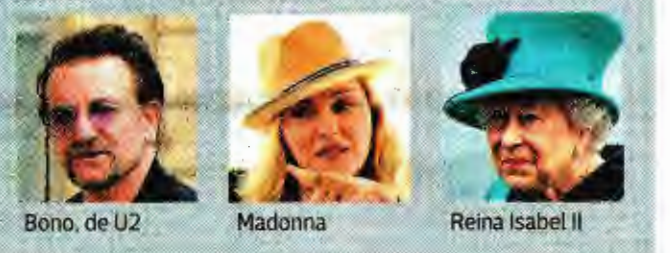
Bono, de U2