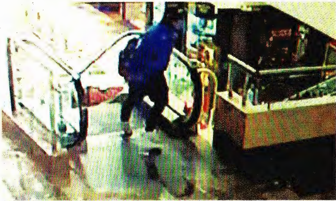
Uno de los presuntos asaltantes, captado por una cámara de seguridad.