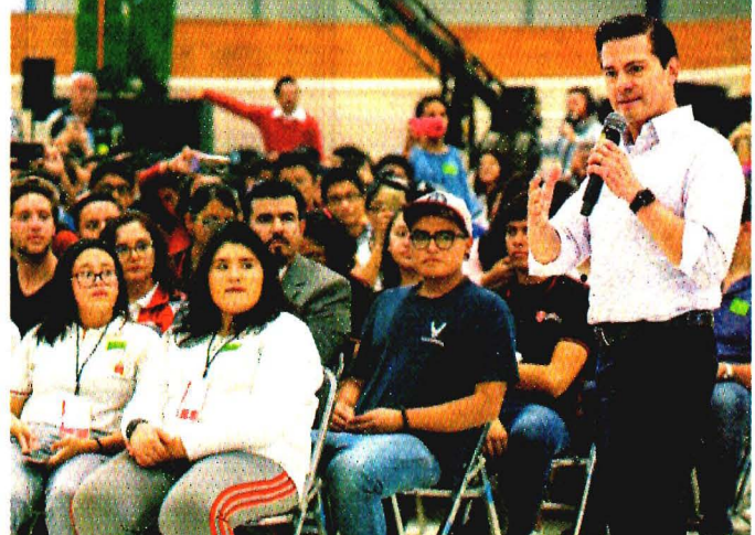
El presidente Enrique Peña Nieto participó ayer en el encuentro Scholas Ciudadanía, con estudiantes de preparatoria mexicanos.