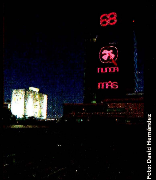
RECTORÍA SE ENLUTA Y PIDE "NUNCA MÁS"