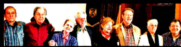
LOS JÓVENES QUE CAMBIARON AL PAÍS

ESTUDIANTE DECLARA ANTE UN POLICIA PATITO