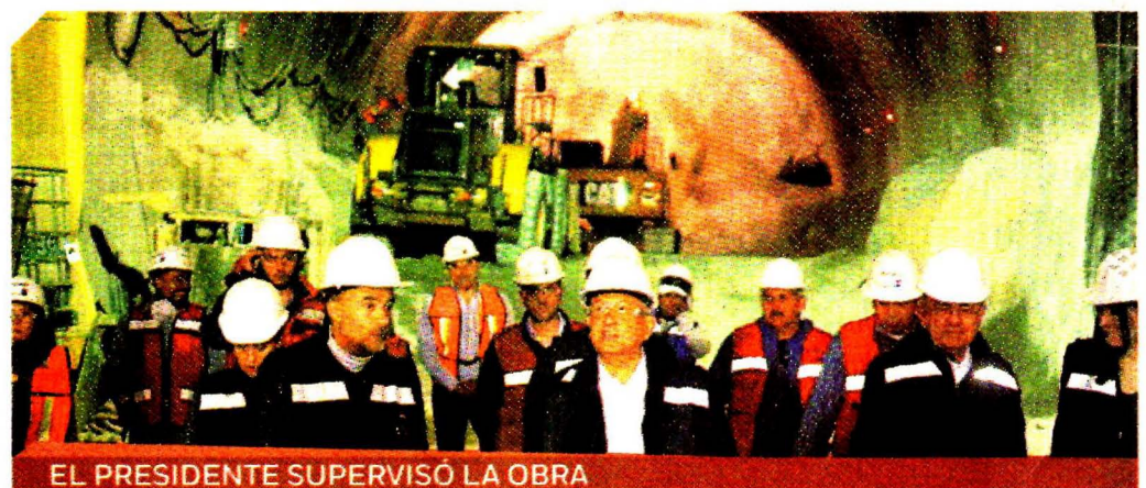
EL PRESIDENTE SUPERVISÓ LA OBRA