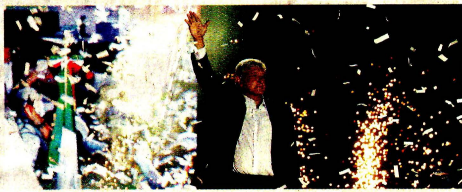
ESTAMOS CERCA DE GANAR PORQUE NO NOS VENDEMOS: AMLO