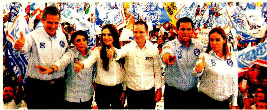
ANAYA AFIRMA QUE EN SU PROYECTO CABEN TODOS