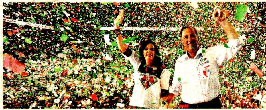
OFREZCO HONESTIDAD A TODA PRUEBA: MEADE