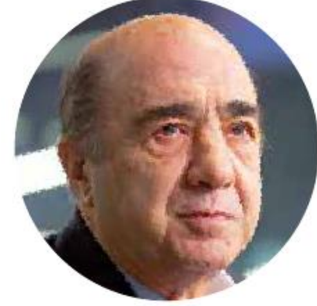
El exprocurador defendió su labor al frente de la indagatoria.