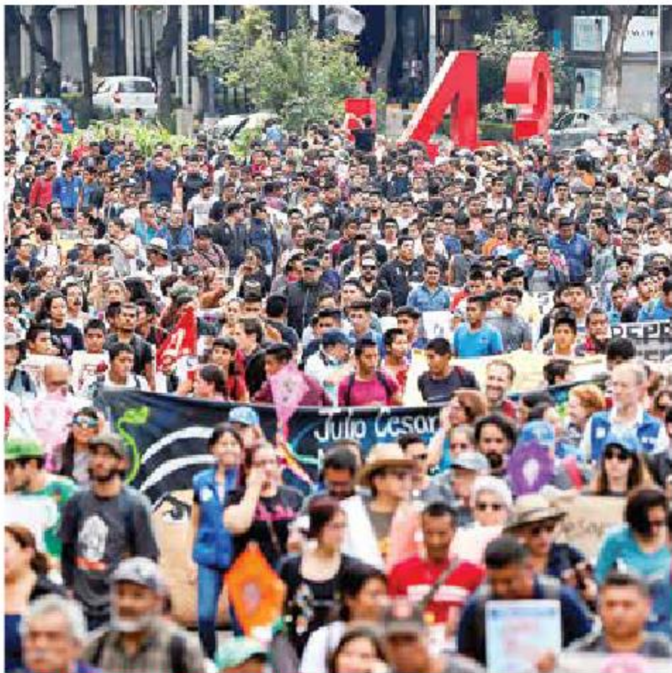
MEMORIA Y RESISTENCIA

En el quinto aniversario de la noche de Iguala, la voz de las víctimas llegó por primera vez a la Cámara de Diputados y el gobierno federal anunció avances de su nueva indagatoria