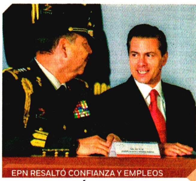
EPN RESALTÓ CONFIANZA Y EMPLEOS