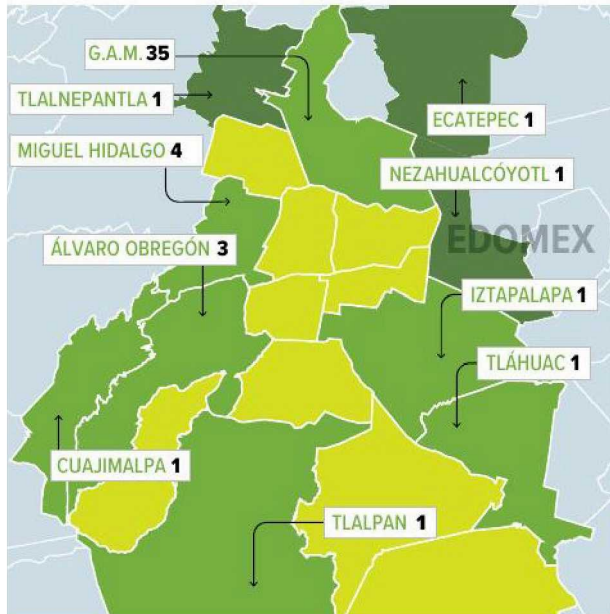
Gráfico: Jesús Sánchez

El reporte más reciente de la Dirección de Epidemiología señala que se han detectado 46 contagios en CDMX y tres en el Estado de México.