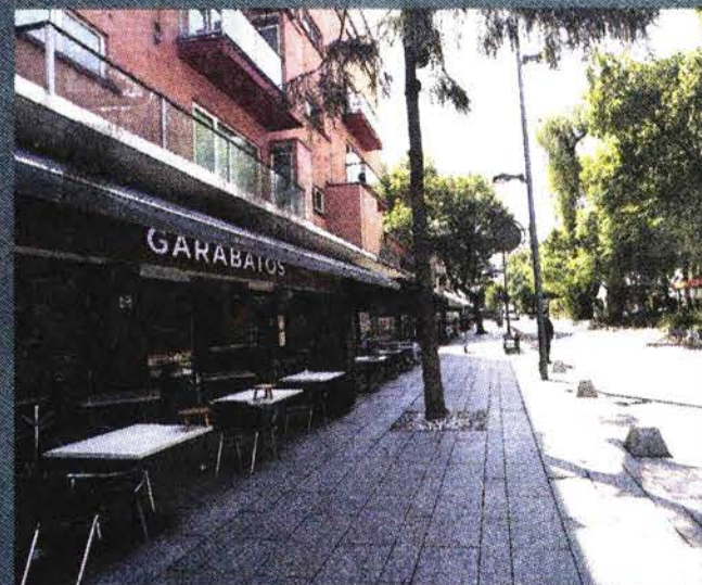
Restaurantes y cafeterías de Polanco (foto) tuvieron poca afluencia de clientes, lo mismo que en el corredor Roma-Condesa.