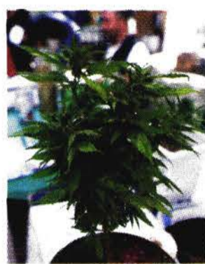
Activistas procannabis se plantaron afuera del Senado.