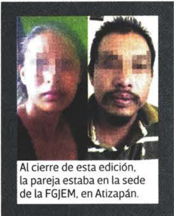
Al cierre de esta edición, la pareja estaba en la sede de la FGJEM, en Atizapán.