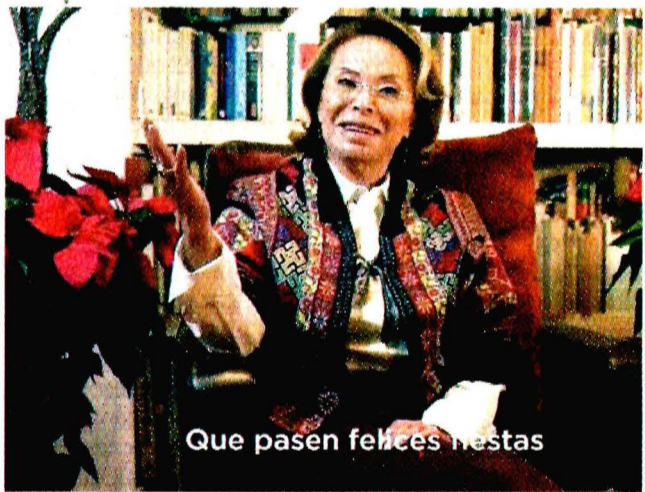
Que pasen felices fiestas