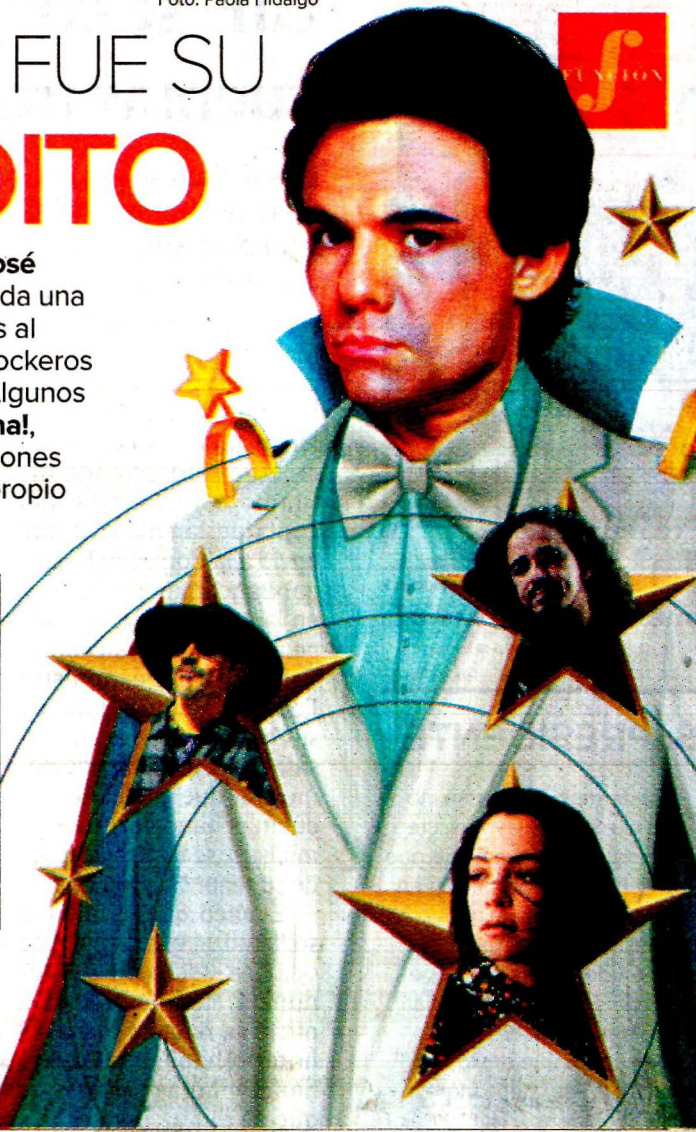
Arte: Jesús Sánchez

LA MALDITA VECINDAD YA LO PASADO, PASADO Escuche el cóver en YouTube