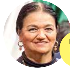
Dulce María Sauri

Tras seis días de tensión, el PAN logró encabezar la Mesa Directiva de la Cámara de Diputados con Laura Rojas como nueva presidenta.