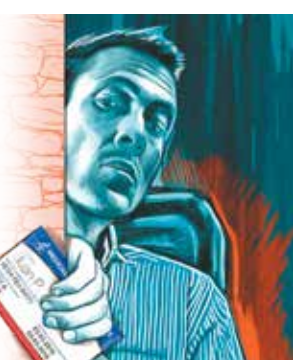
Ilustración: Jesús Sánchez