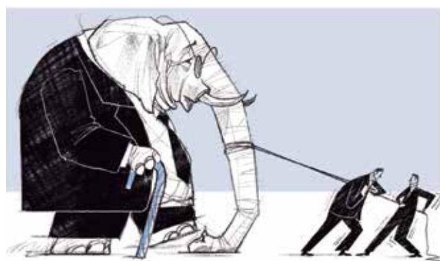
Ilustración: Horacio Sierra