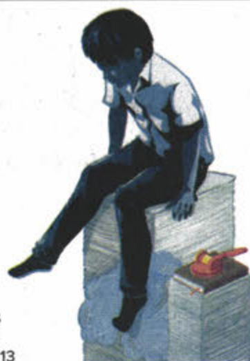
Ilustración: Jesús Sánchez