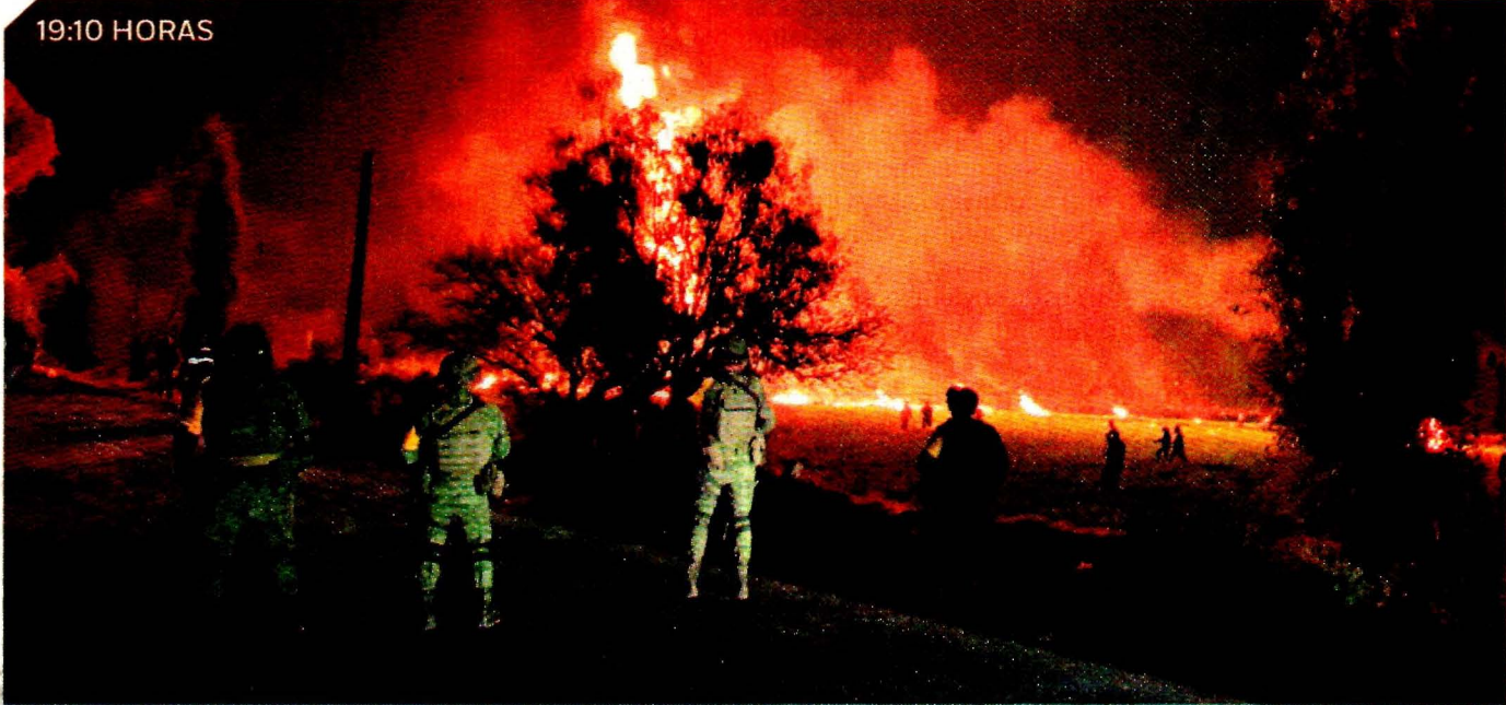
LLAMAS. Tras dos horas de rapaña, la toma clandestina explotó mientras personas aún estaban en el lugar. La Sedena activó el Plan DN-III para auxiliar a la población afectada y vigilar la zona del incidente. Las llamas fueron sofocadas poco antes de medianoche, indicó la SSP.

El presidente Andrés Manuel López Obrador acudió anoche a Tlahuelilpan, donde afirmó que la tragedia no cambiará la estrategia de combate al huachicoleo que ha emprendido su administración.