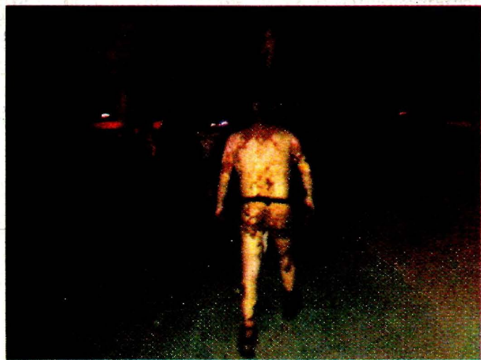
Varios lesionados salieron por su propio pie del área donde estalló la toma. Algunos de los más graves fueron trasladados a la CDMX.