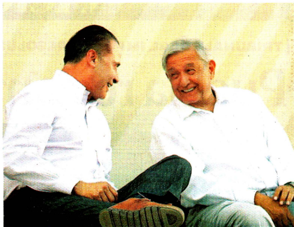
ANDRÉS MANUEL LÓPEZ OBRADOR VISITÓ SINALOA

También, cuatro mil 807 depósitos de mil 122 pesos para pavos y cuatro mil 957 depósitos de 12 mil 500 pesos por concepto de fin de año. PRIMERA | PÁGINA 4