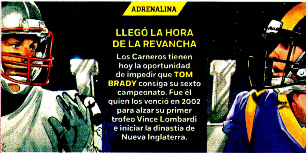
Ilustración: Horacio Sierra

Opositores al líder chavista protestaron en Caracas y otras ciudades venezolanas para exigirle que deje al cargo a Guaidó.