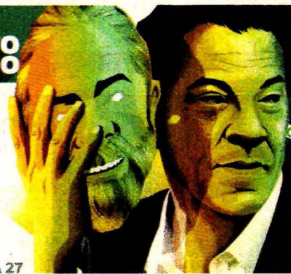
Ilustración: Luis Flores