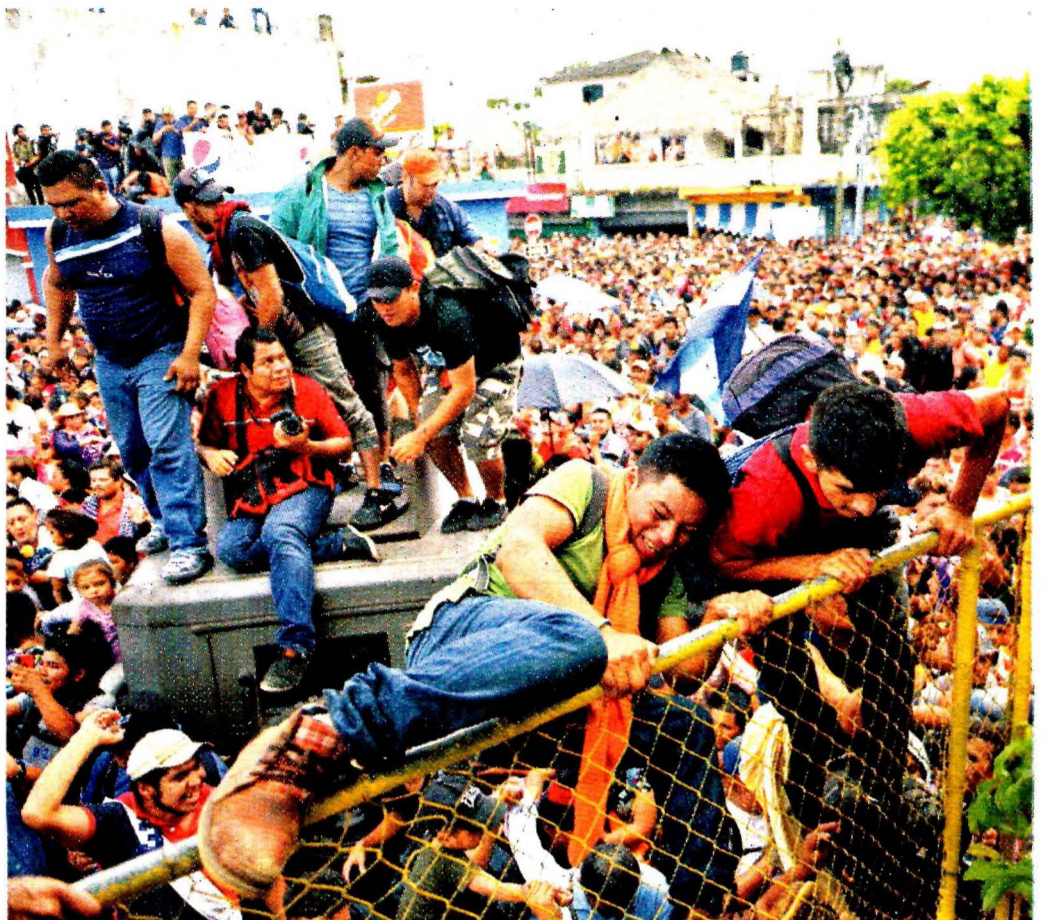
IRRUPCIÓN. Antes de cruzar hacia Chiapas, migrantes saltaron una valla en Tecún Umán, Guatemala.