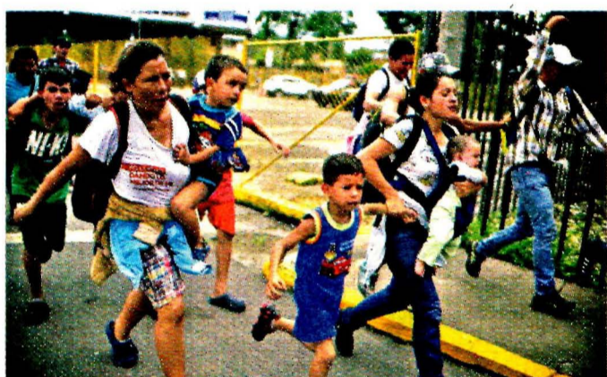
PUNTA DE LANZA. Al frente del grupo que salió de Guatemala iban mujeres y niños, varios de ellos en brazos de sus madres.