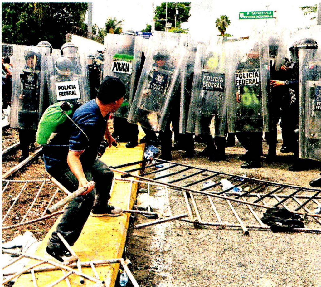
VIOLENCIA. Integrantes de la caravana agredieron a agentes de la PF que les acotaron el paso al país.