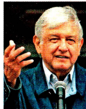
INVITA A TRUMP A INVERTIR EN CENTROAMÉRICA