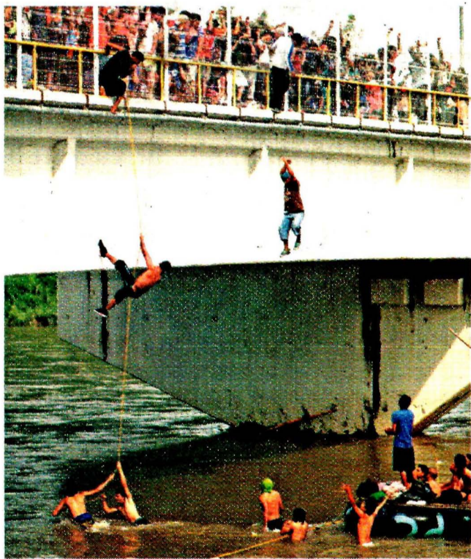
DESESPERACIÓN. Al quedar varados en el puente fronterizo, algunos hondureños buscaron cruzar hacia México por el Suchiate.