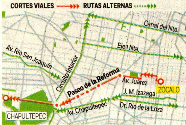
Gráfico: Jesús Sánchez