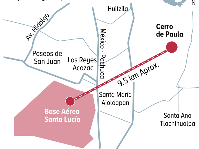
Gráfico: Erick Zepeda

Por ley, los vestigios no pueden ser tocados ni modificados.