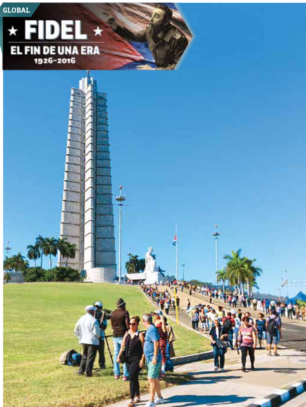
LA ISLA SIN FIDEL. A media tarde, 200 mil personas habían acudido al Memorial a José Martí, para rendirle homenaje al líder de la Revolución Cubana, dio a conocer la televisión estatal.